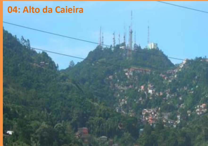
04: Alto da Caieira