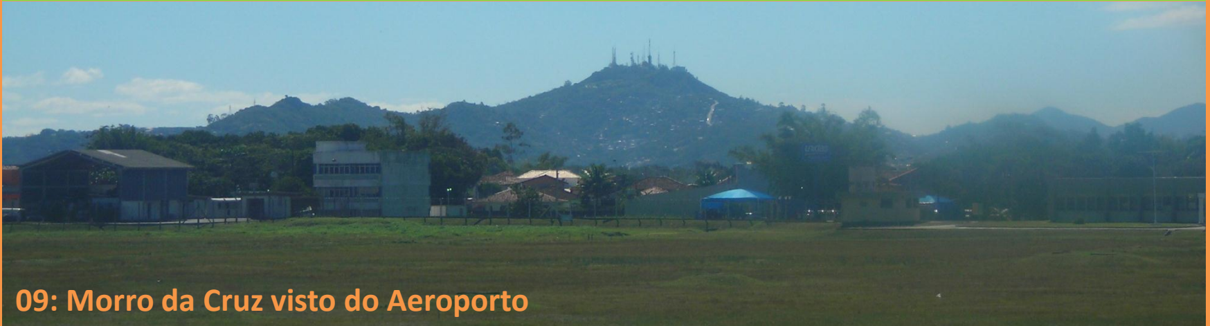
09: Morro da Cruz visto do Aeroporto