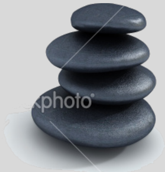
Figura 2– Representação da ordem