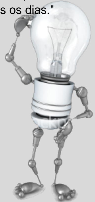
Figura 1– Representação da idéia

"Infelizmente, um modo de projetar muito difundido nas escolas consiste em incitar os alunos a encontrar idéias novas, como se tivessem de inventar tudo, desde o princípio, todos os dias." (MUNARI, 1998 p.12)