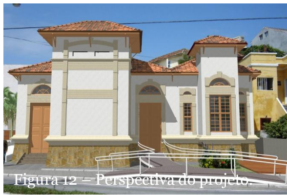
Figura 12 – Perspectiva do projeto.