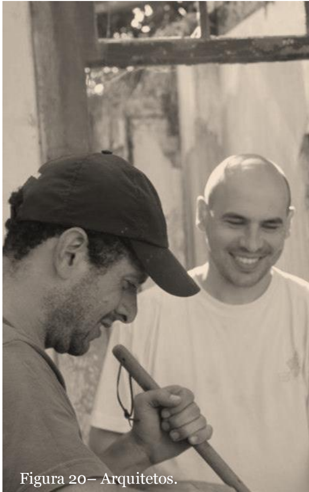
Figura 20 – Arquitetos.

Consideramos que nossa metodologia é fruto da mistura de informações que recebemos da universidade, a qual tinha foco na nossa área de trabalho e as orientações de alguns bons profissionais que tivemos contato no início da vida profissional.