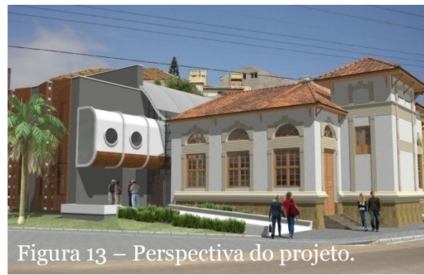
Figura 13 – Perspectiva do projeto.