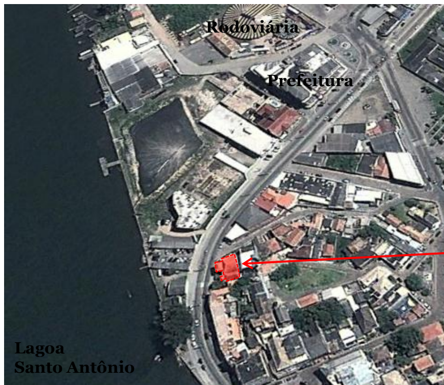
Figura 06 – Localização Memorial Tordesilhas

Localizado na Av. Colombo Machado Salles, no Centro de Laguna/SC.