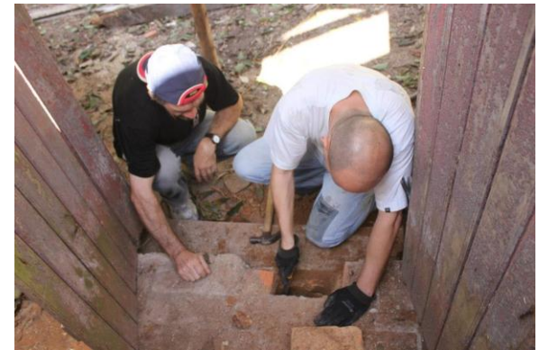
Figura 01, 02, 03 – Obra de restauro em Laguna/SC – Casa do Capitão Donner.