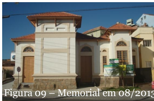
Figura 09 – Memorial em 08/2013