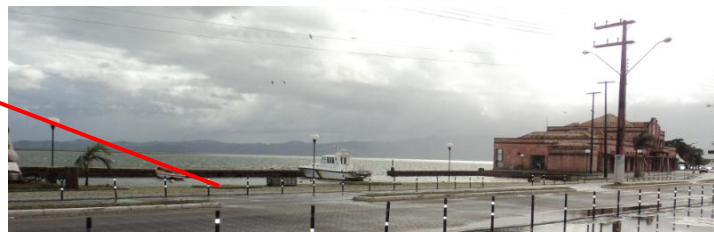
Figura 14 – Localização do Mercado Público.