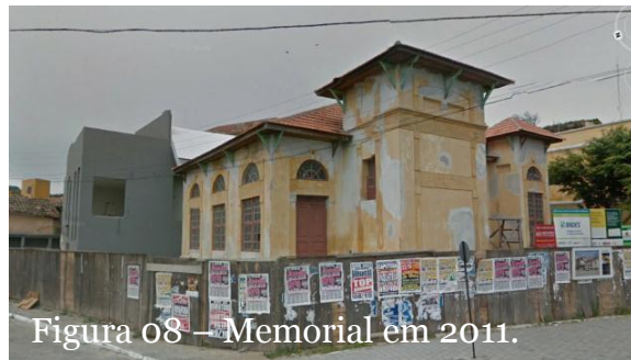
Figura 08 – Memorial em 2011.

O projeto do Memorial Tordesilhas foi desenvolvido pela empresa Arte Real Arquitetura e Restauro Ltda contratados pelo IPHAN através de processo licitatório.