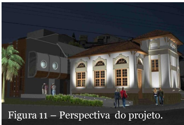
Figura 11 – Perspectiva do projeto.