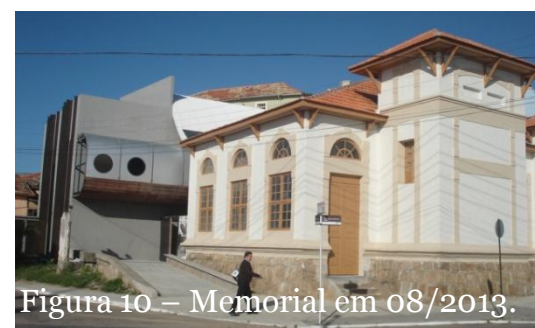
Figura 10 – Memorial em 08/2013.