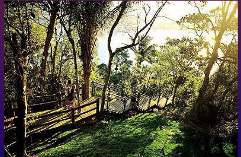
Foto 02 – Escadaria em madeira, numa das paradas da Est. Mata Atlântica.